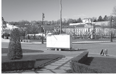
شكل رقم (٢) صورة توضح أحد أنواع محطات التقوية الملحقة بالأبراج.

وهي خزانات صغيرة أو غرف لا تتجاوز مساحتها (٢٥) متر مربع مثبتة على الأرض بجوار أبراج الاتصالات أو على أسطح المباني، وتحتوي على أجهزة ومعدات الاتصال المطلوبة لتشغيل الهوائيات. ويوضح الشكل رقم (٢) أحد أنواع محطات التقوية