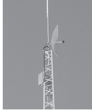
شكل رقم (٤) صورة توضح بعض أنواع الهوائيات المثبتة على الأسطح أو الأبراج