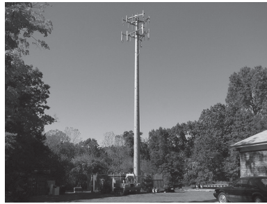
شكل رقم (٢) صورة توضح أحد الأبراج الأحادية.

وهي أبراج على شكل أعمده مثبتة على قاعدة أرضية قائمة بذاتها أو مشدودة بكيايل، ويثبت أعلاها أجهزة بث واستقبال الترددات اللاسلكية. وتكون بإرتفاعات تصل إلى (٩٠) تسعون متراً. ويوضح الشكل رقم (٢) أحد أنواع هذه الأبراج.